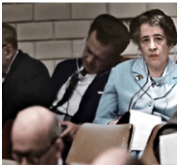
Hannah Arendt under retssagen mod Adolf Eichmann i 1961 i Jerusalem, Israel.

Forsvaret er interessant, fordi det sætter fingeren på et ømt punkt i den politiske samtale; velmenende, fordi det er drevet af en dyb dedikation til denne samtale, og eksemplarisk fordi det – i lighed med mange andre faktafortalere – ikke kommer helt i mål med sit forsvar for kendsgjerningernes rolle i samtalen. Dermed giver Arendt også bolden op til at overveje, hvilke alternativer der kunne være til at insistere behårdt på bestemte fakta som kur mod den politiske misere, verden synes at befinde sig i. Dette spørgsmål skal selvfølgelig være temaet for den sidste del af nærværende tekst.